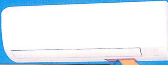
機種名・製造番号・製造年の表示シール